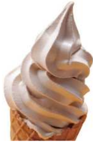
氷温熟成®珈琲ソフトクリーム 450円

「瀬戸内産レモン果汁」使用。はちみつの優しい甘さとレモンの爽やかな酸味が特徴です。