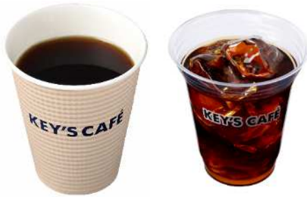
氷温熟成®珈琲 Rサイズ 350円 (ホット/アイス)