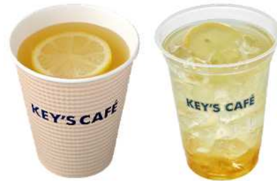
レモネード Rサイズ 450円 (ホット/アイス)

「瀬戸内産レモン果汁」使用。はちみつの優しい甘さとレモンの爽やかな酸味が特徴です。