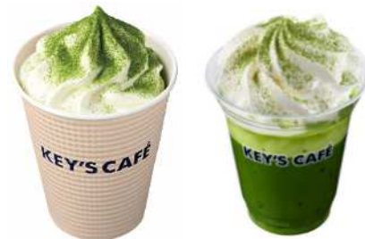
抹茶ラテ Rサイズ 450円 (ホット/アイス)

氷温熟成®珈琲を使って抽出したエスプレッソを直接混ぜ込んで作るため、しっかりと珈琲の香りとコクを味わえる本物の「珈琲ソフトクリーム」です。