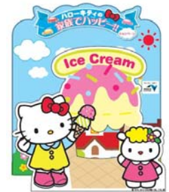
ハローキティ フォトパネル