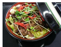
写真:草津PA下り線メニュー『近江牛ヘルシー丼』

手作りメニューや地域の食材を取り入れた郷土色あふれるメニューなど、その店自慢のメニューを「一店逸品メニュー」として提供します。