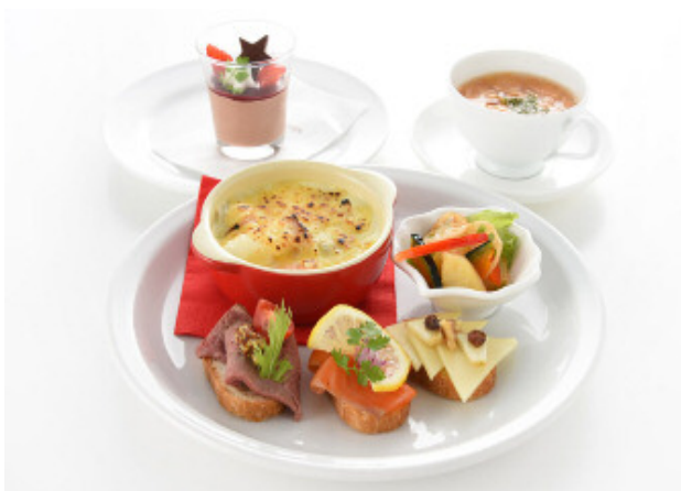
ウインタープレート 1,280円(税込)