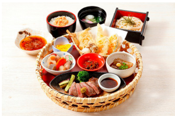
筑前味めぐり 那の里花かご御膳 1,706 円(税込)