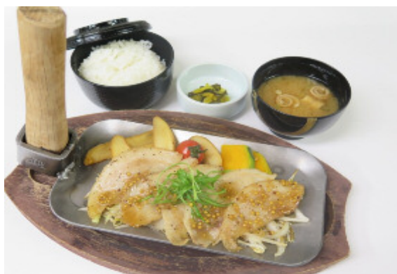
さよう姫ポークのトントロ燗焼き御前 1,300 円(税込)