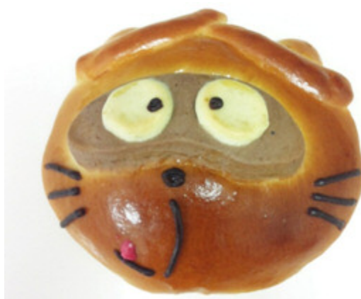
のん太のパン 291円(税込)