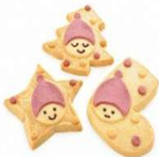
ニッセクッキー 399円(税込)