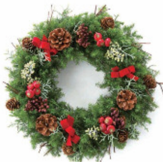
クリスマスリース 3,000円(税込)～