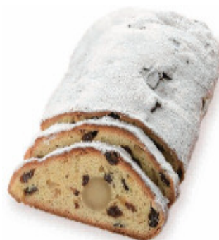
マンデルシュトレン S 1,566円(税込)