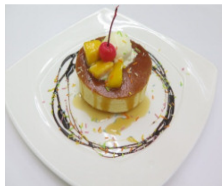
厚焼きパンケーキ 600 円(税込)