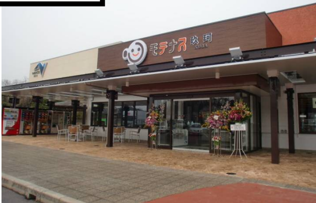
建物前面に大屋根を設置 (※写真は玖珂PA上り線です)