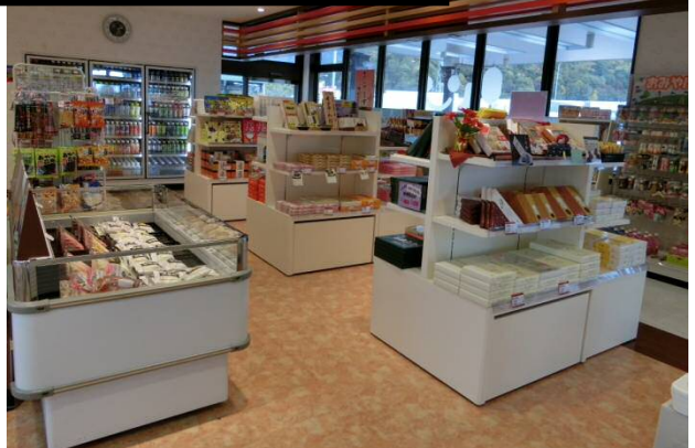
通路の広い店内でゆっくりお買いものをどうぞ (※写真は玖珂PA上り線です)