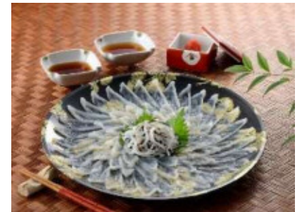
やまぐち旬彩海峡本舗 「国産とらふぐ刺しセット」